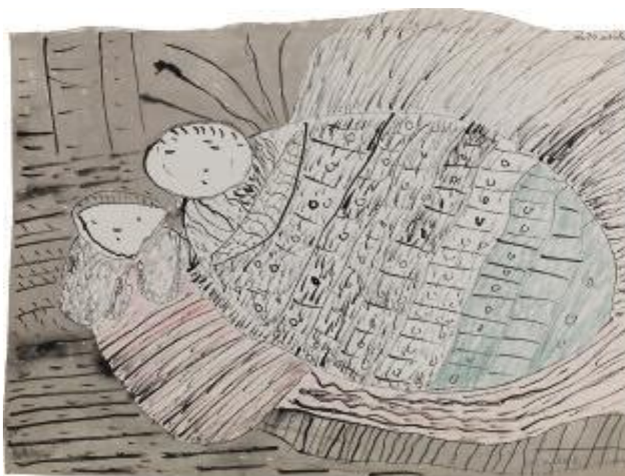
Personnages religieux , 20 octobre 1957 encre noire et crayon de couleur sur papier 30 x 41.5 cm