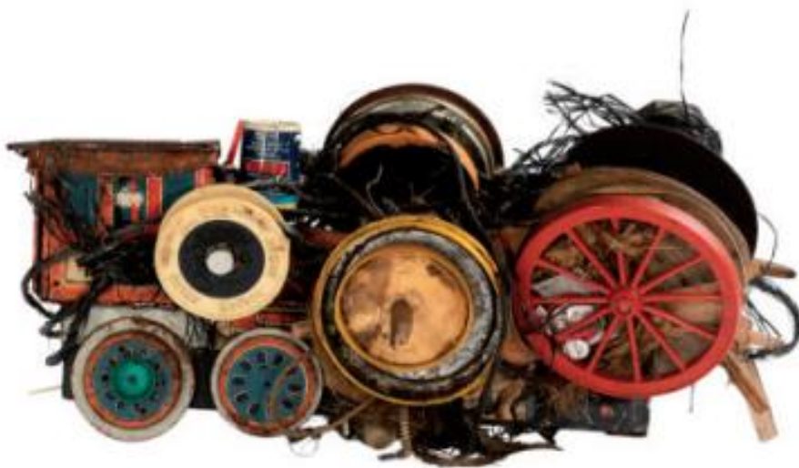
Sans titre, non daté, assemblage de matériaux divers, 20 x 30 cm

Plusieurs assemblages de Jean Bordes sont conservés dans la collection art hors-normes. Sauvée de la destruction par Jano Pesset, La Fabuloserie est l'unique lieu où est présenté ce qu'il reste de sa production. Façonnés à partir de matériaux récupérés dans des dépotoirs, à la suite du décès de Jean Bordes, un proche parent pensa renvoyer ces constructions dans leur lieu d'origine : la décharge. Méprisée, rejetée, comme tant d'autres productions défiant les normes, Alain Bourbonnais ne dissimulera pas son enthousiasme devant une telle découverte, s'exclamant : « Il n'y a pas pire que lui en Art Brut, c'est le SUMMUM de l'Art Brut, le plus déconnecté, le plus fort. » (extrait notice catalogue)