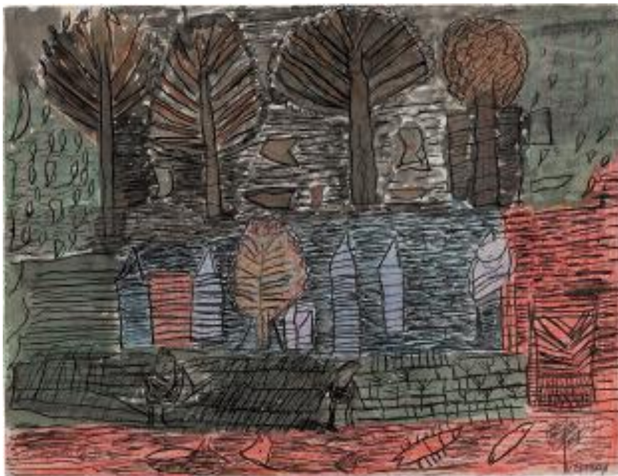
Sans titre , 1964 encre noire et crayon de couleur sur papier 24 x 31.5 cm