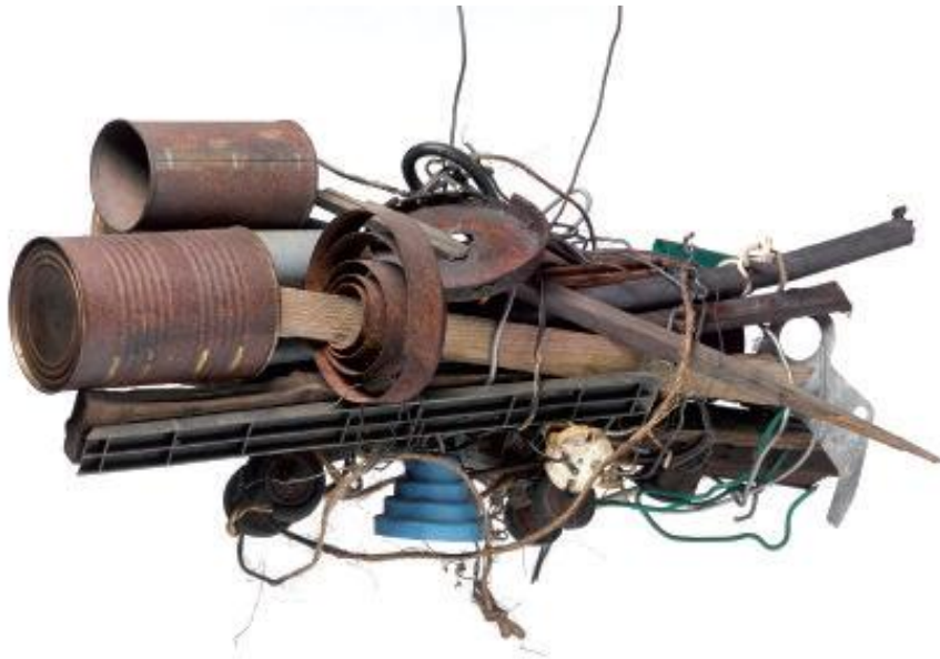
Sans titre, non daté, assemblage de matériaux divers, 16 x 40 cm

1916, AUGIREIN (FRANCE) / 1985, SAINT-LIZIER (FRANCE)